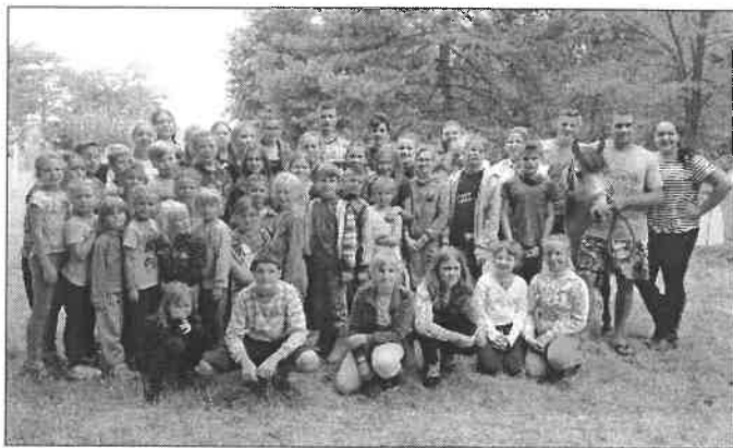
Az idei lovastábor résztvevői

A csantavéri Börcsök-tanyán idén negyedik alkalommal szervezték meg a lovastábor. A ma záruló négynapos táborban negyvenkét öt és tizenhat év közötti gyermek vett részt.